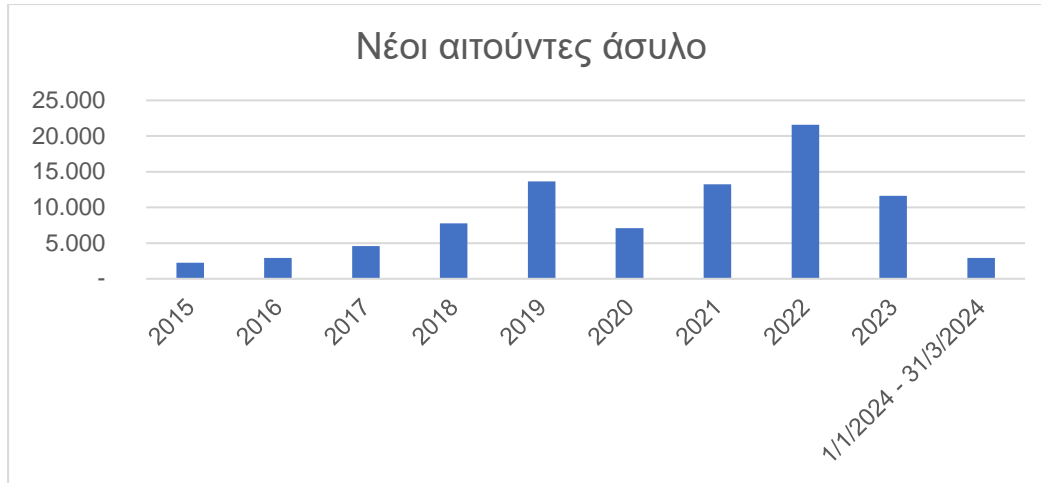
Πίνακας 6 Νέες Αιτήσεις Ασύλου

Το Πρόγραμμα του Ταμείου Εσωτερικής Ασφάλειας (ΤΕΑ) για την Προγραμματική Περίοδο 2021-27 (εφεξής Πρόγραμμα), εγκρίθηκε με την υπ' αριθμό C(2023) 293/11.01.2023. Εκτελεστική Απόφαση της Ε.Ε την 11 η Ιανουαρίου 2023. Για την νέα Προγραμματική Περίοδο 2021-2027, στόχος του Ταμείου είναι να συμβάλει στην εξασφάλιση υψηλού επιπέδου ασφάλειας στην Ένωση, ειδικά με την πρόληψη και την καταπολέμηση της τρομοκρατίας και της ριζοσπαστικοποίησης, του σοβαρού και οργανωμένου εγκλήματος και του κυβερνο-εγκλήματος, με την παροχή βοήθειας και την προστασία των θυμάτων εγκληματικών πράξεων, καθώς και με την προετοιμασία για την αντιμετώπιση περιστατικών, κινδύνων και κρίσεων που συνδέονται με την ασφάλεια, με την προστασία έναντι αυτών και με την αποτελεσματική διαχείριση τους, εντός του πεδίου εφαρμογής του Κανονισμού 2021/1149 του Ευρωπαϊκού Κοινοβουλίου και του Συμβουλίου της 7ης Ιουλίου 2021.