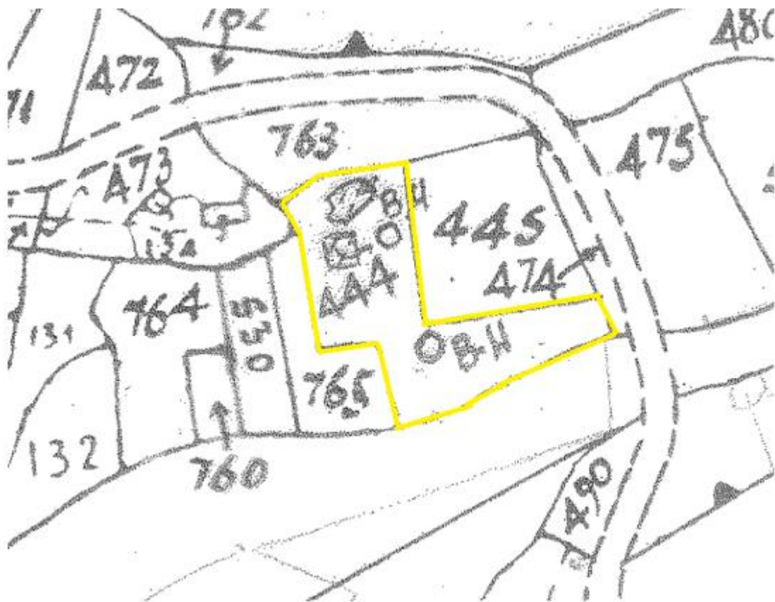
Φύλλο/Σχέδιο: 47/47 – Τεμάχιο: 444