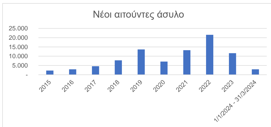
Πίνακας 6 Νέες Αιτήσεις Ασύλου